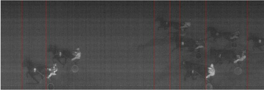
6. løb: 5-7-4 17,2