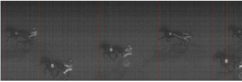
5. løb: 5-3-7 19,0