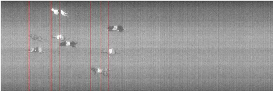
7. løb: 6-5-2 14,5