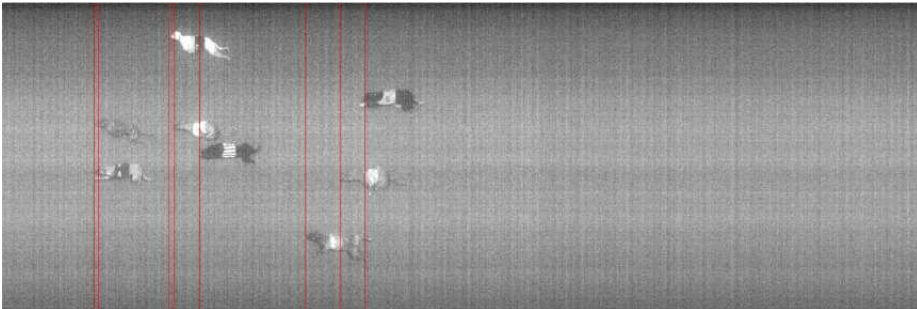
8. løb: 2-5-7 18,4